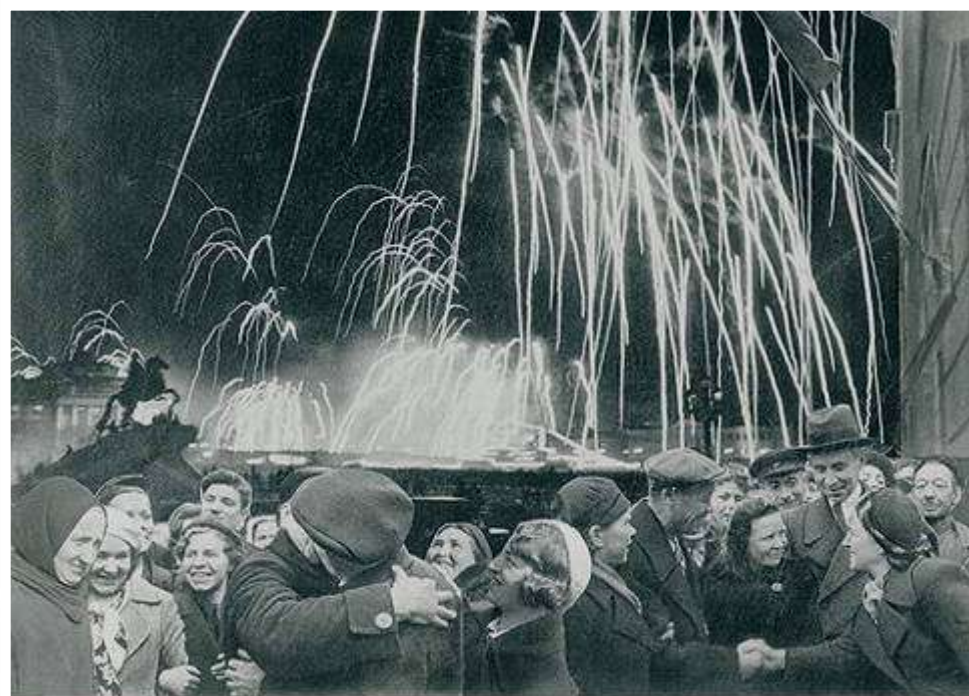
«ВЕЛИКАЯ ПОВЕДА ОДЕРЖАНА СОВЕТСКИМИ ВОЙСКАМИ ПОД ЛЕНИНГРАДОМ:»

Победе радовалась вся страна, но эта радость была со слезами на глазах, так как в каждой семье, в каждом доме кто-то погиб на этой страшной войне.